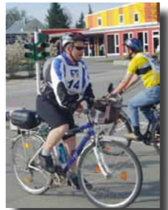
Beispiel für arbeitsbegleitende Maßnahmen: Fahrradtraining