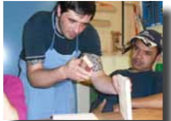
Praktische Anleitung in den Arbeitsbereichen